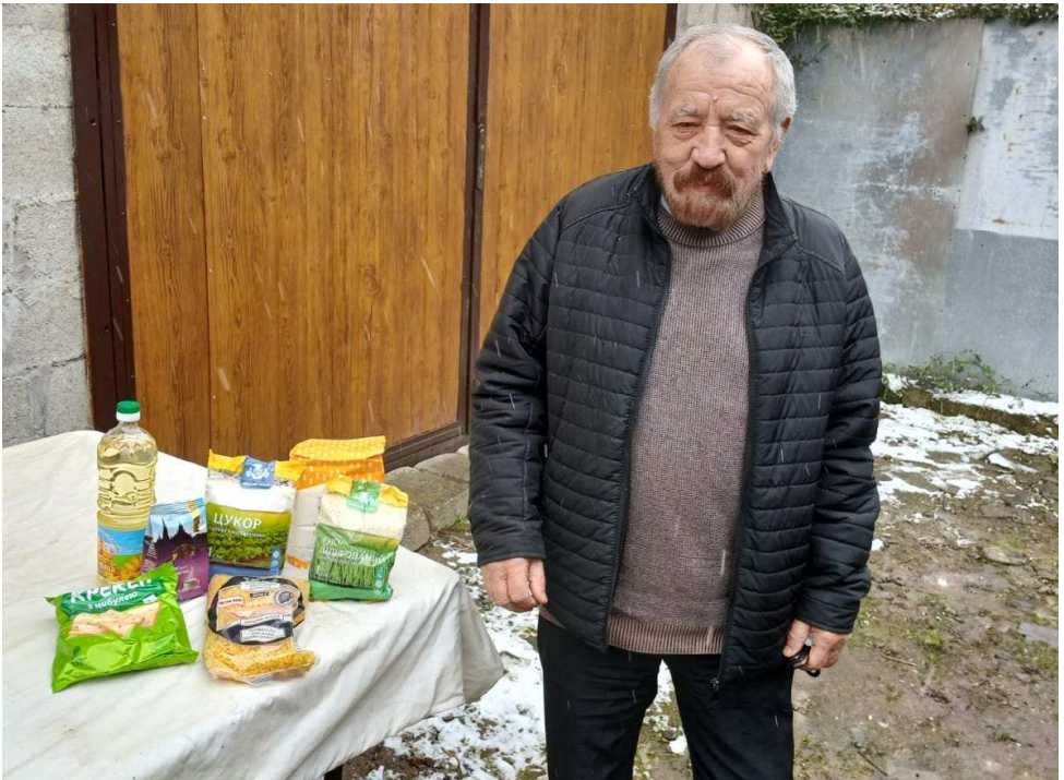
(Distribúcia potravín v Zakarpatskej oblasti)

Potravinové balíčky distribujeme mesačne ľuďom, ktorí sú v núdzi a odkázaní na pomoc druhých. Ľudia sú vďační za každý dar, ktorý im uľahčí ich strádanie. Zvlášť teraz, keď mnohí umierajú v nezmyselnej vojne, ktorej sa zdá byť koniec v nedohľadne.